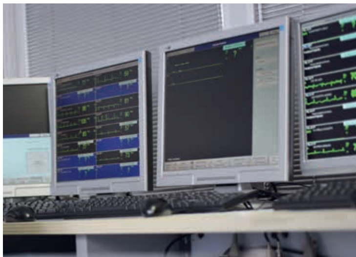
Monitor telemetrie all'interno del reparto di degenza dell'U.O. di Cardiologia Riabilitativa.

Durante la degenza le persone assistite, per il controllo del loro stato di salute, sono sottoposte a: