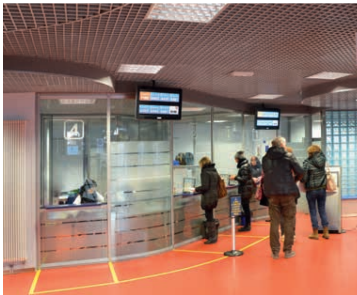
Gli sportelli di accettazione, prenotazione e cassa all'ingresso del padiglione E.