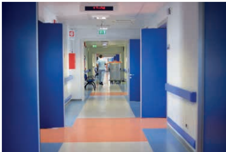
Corridoio nel reparto di degenza dell.U.O. di Cardiologia Riabilitativa.