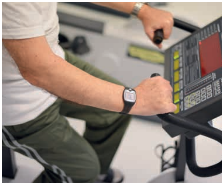
L'attività riabilitativa nella palestra dell'U.O. di Cardiologia Riabilitativa.

Al termine del programma riabilitativo vengono esaminati i dati rilevanti dagli accertamenti clinici e strumentali di ogni singola persona assistita. Il medico compila una lettera di dimissione, in cui sono riportati gli esiti dei suddetti accertamenti, la terapia farmacologica e le indicazioni cui dovrà attenersi la persona al rientro al domicilio. Inoltre potranno essere consigliati gli eventuali accerta-