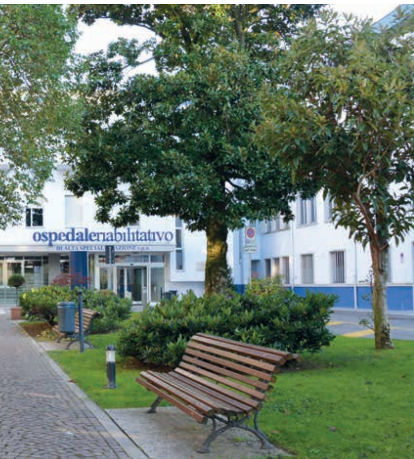
L'entrata principale della struttura che porta al padiglione E.