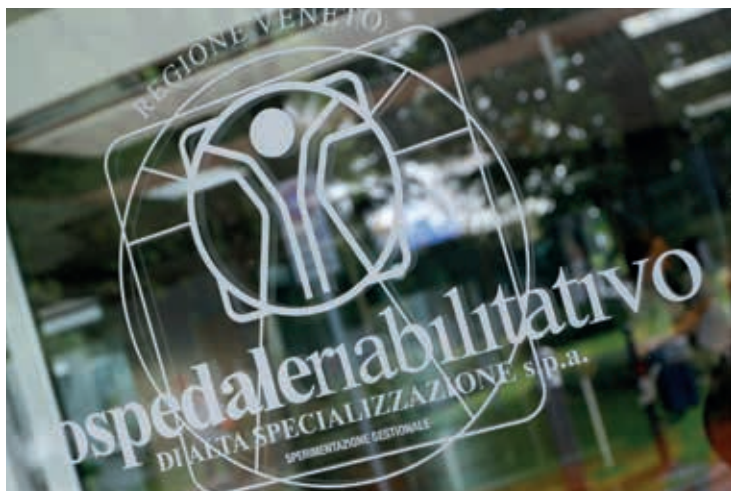
Il logo di O.R.A.S. all'entrata del padiglione E.