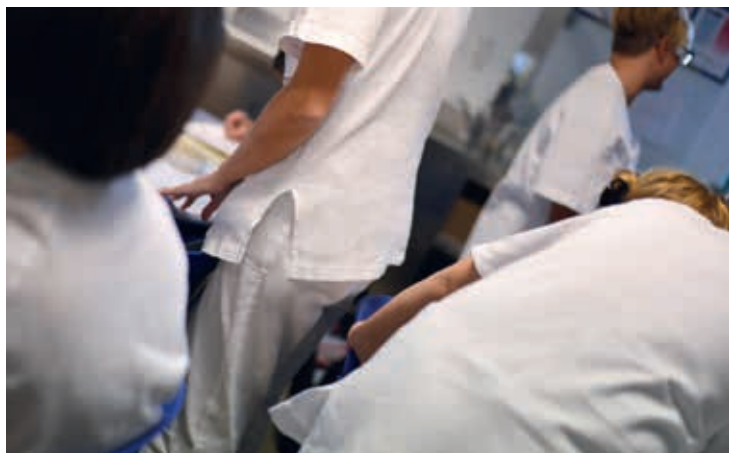
Personale sanitario di reparto al lavoro.

Presso l'Ospedale presta servizio personale sanitario, tecnico e amministrativo. Al fine dell'immediato riconoscimento da parte delle persone assistite, ciascun operatore reca in modo visibile, il cartellino con l'identificazione dell'Unità Operativa o servizio di appartenenza.